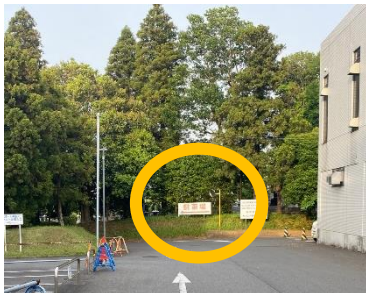
市民会館を正面に右に曲がり 「駐車場」の看板を左に曲がります