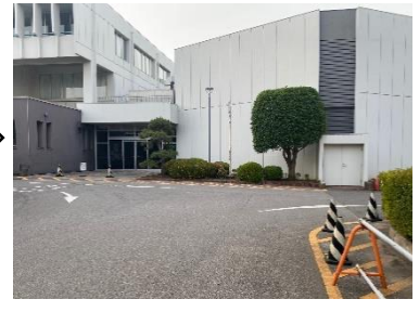
突き当たりを左に曲がります