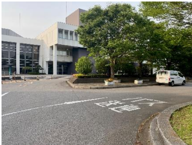
「バス送迎」の表示に沿って 進んでください

バス・車でご来場のチームは「八千代市市民会館」(〒276-0044 千葉県八千代市萱田町 728)にお越しください。