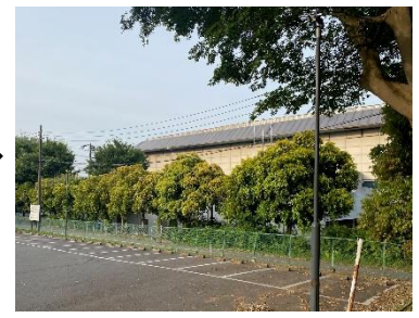
右手に見える建物が「八千代市 市民体育館」です