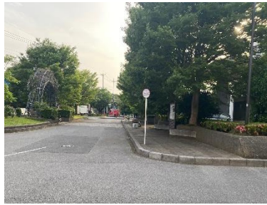
路線バスも同じロータリーを使用します 速やかに乗降をお願いします